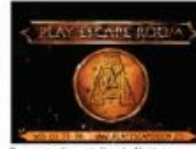
Dues entrades gratuïtes de Alcatraz Play Escape Room