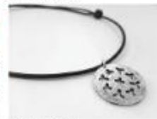
Un colgare de plata Associació del Taller