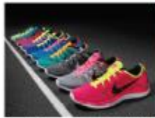
Unes deportivas per un valor màxim de 30€ Sabateria Xagi