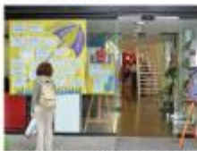
1 incipció a un taller del casal de la Rambla Casal Poblenou