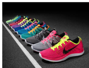
Unes deportives per un valor màxim de 30€ Sabateria infantil XAGRI