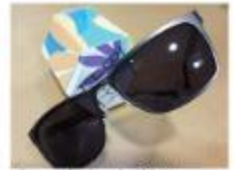
Ulleres graduades o de sol de Happy Òptica Vendrell