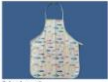
Delantal para niños Suit Beibi