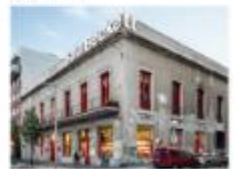
Entrada doble per teatre Sala Beckett