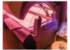
Un box de 120 minuts per fer sol B&Bbronzejat i bellesa