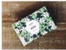
Bossa de tela + Sabó artesanal de gespatí d'Alissa Perfums Isidre cosmetic shop