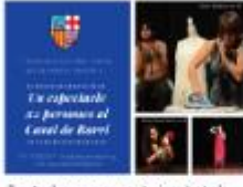
2 entrades per representacions teatrals Casal Bach de Roda