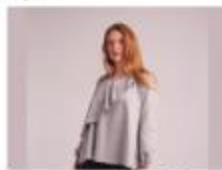
Samarreta casual col·lecció Sister Dew Sister Dew