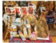
Lot de productes Xarcateria J.Tena