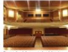
2 entrades dels espectacles del casino Casino de l'Aliança