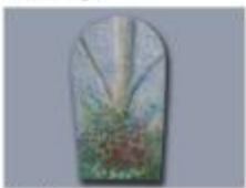
Un quadre Belles Arts El Taller