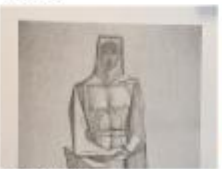
Espai Subirach Visita guiada, bossa i reproducció.