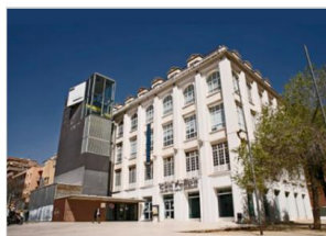
Una entrada familiar per teatre infantil Eix Comercial Poblenou