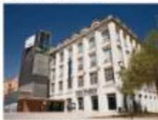
Una entrada familiar per teatre infantil Can Felipa