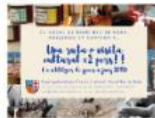
2 punys de visites guiades Casal Bach de Roda