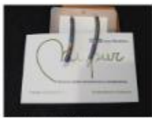
Aracades en plata i cristall Napur