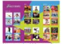
1 bimestre qualsevol dels nostres tallers A la cubana