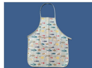
Delantal para niños Suit Bebi