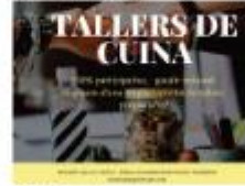
Assistència taller gratuït Teixidó Taula i Cuina