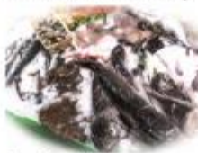
Compra de peix de 50 € Peixos Aiticia