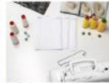
Un taller de costura Vernita Studio&Shop